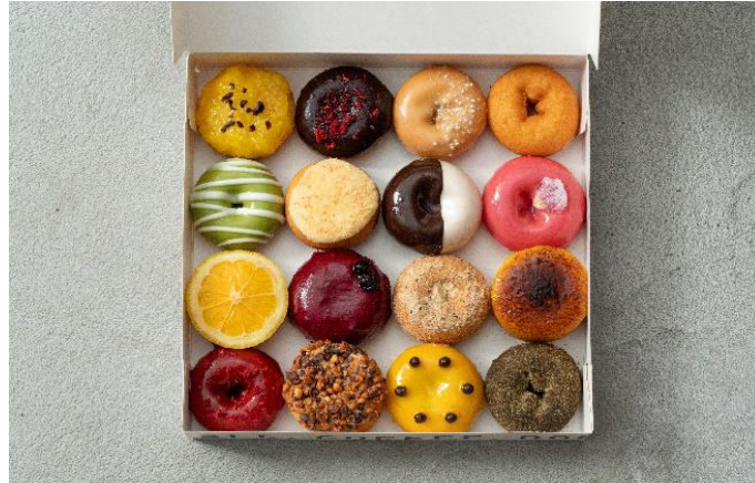
ROOTH 16 BOX

ROOTH ドーナツは人工甘味料、保存料不使用の直径 5 cm のドーナツ。カラフルなコーティングドーナツ、シンプルなパウダードーナツ、日本の四季を感じられるように厳選した旬のフルーツを使用し、フルーツ本来の味と香りにこだわったまるでフルーツなプレミアムドーナツ『ROOTH×FRUITS』を提案しています。