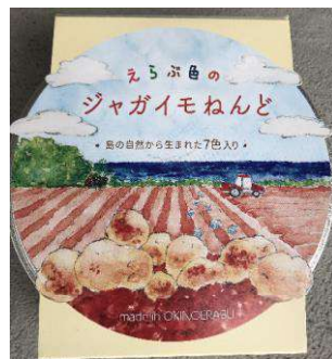
ジャガイモねんど