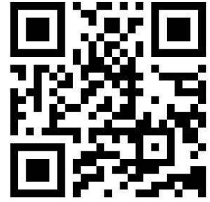
モササウルス・バーガー

クラフトペーパーで作られたモササウルスキットを動画を見ながら組み立てる。 シカゴバーガーとヴィーガンバーガーの2種類のバーガーとクリームソーダのセット。 手のひらサイズのシカゴバーガーとマッシュルームをバンズに見立てナスとトマトを挟んだヴィーガンバーガー。