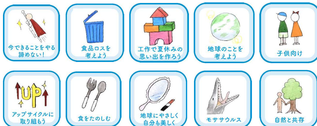
ROOTH GREEN RECOVERY の 10 要素

※本イベントに合わせて映画「ジュラシックパーク」主演俳優のサム・ニール氏よりサイン入り写真が贈られてくる予定です。