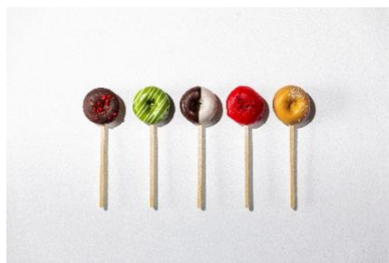
1 個売り（スティック棒）

ニューヨークで着想を得て開発した直径 5cm のドーナツは生地にヨーグルトを入れ、甘さを控えひとつひとつを手作りのコーティングで仕上げたカラフルなドーナツ。