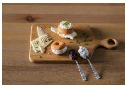
小倉限定ドーナツ