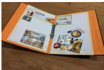
コンシェルジュブック画像

ROOTH ホストが街を巡り、おすすめの場所、お店、人などをご紹介する手づくりブック。街のコン