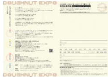
「ドーナツ博」専用応募用紙