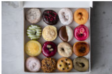
ROOTHの16個入りドーナツ