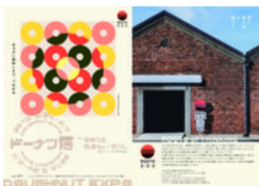
ドーナツ博フライヤー